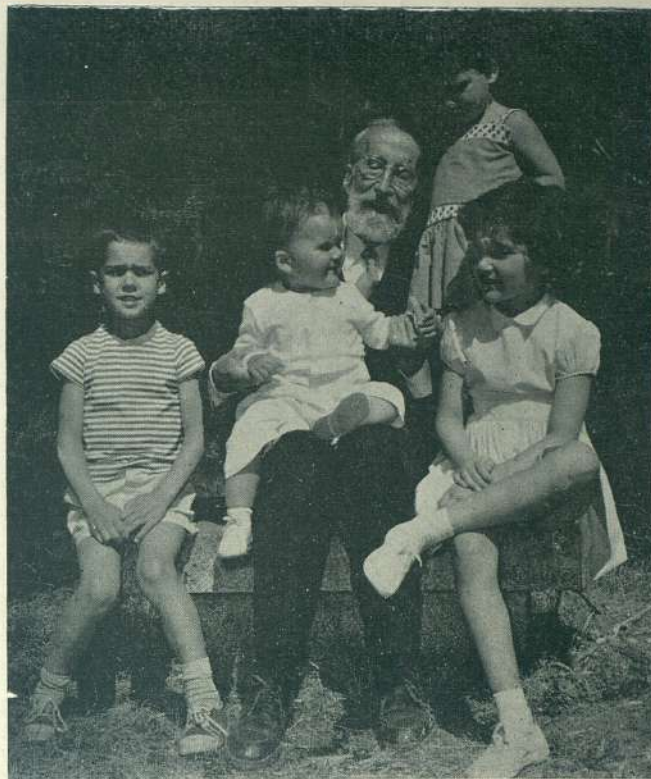
Los biznietos son, junto con los árboles y el paseo cotidiano, la única distracción que el ilustre escritor se permite.

La charla ha de girar forzosamente en torno a Hispanoamérica. Noto que le es tema grato. Y prosigue el maestro: