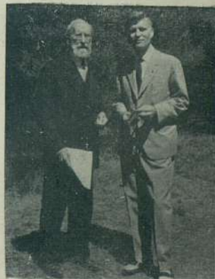
D. Ramón Menéndez Pidal con el autor de este reportaje. (Fot. Leandro de la Vega).

Esta es su actualidad. La que empezó a serlo hace setenta años, y que solo puede premiarse con... un "Nóbel", por ejemplo. El que está pidiendo a gritos la fabulosa obra de D. Ramón Menéndez Pidal, ilustre decano de las letras españolas.