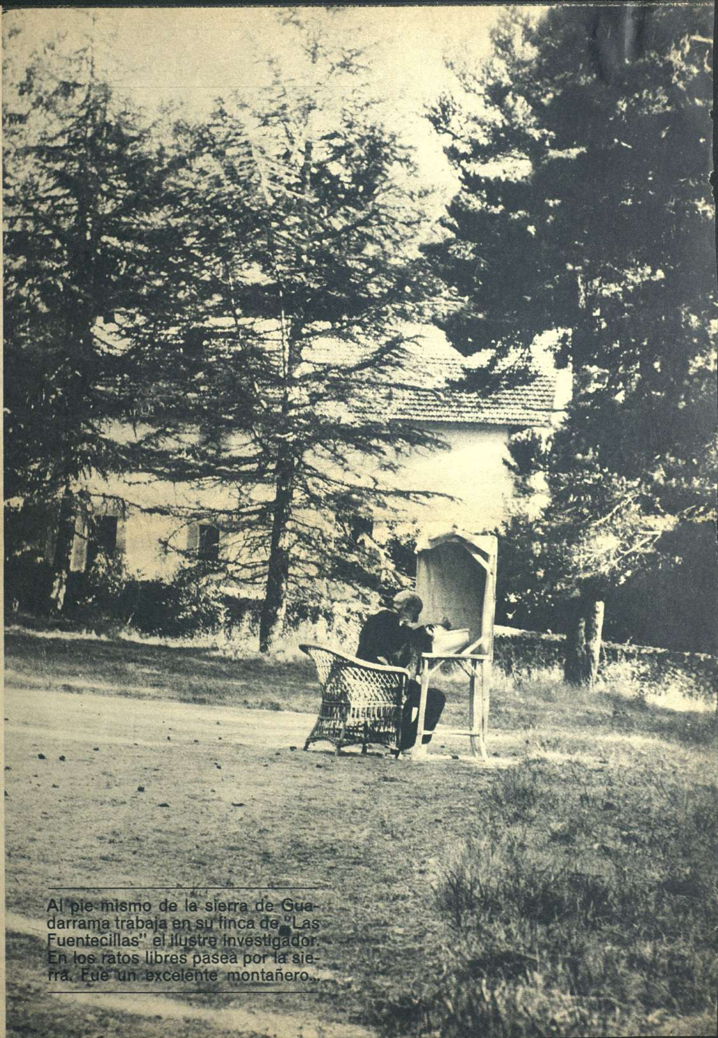
Al pie mismo de la sierra de Guadarrama trabaja en su finca de "Las Fuentecillas" el ilustre investigador. En los ratos libres pasea por la sierra. Fue un excelente montañero...