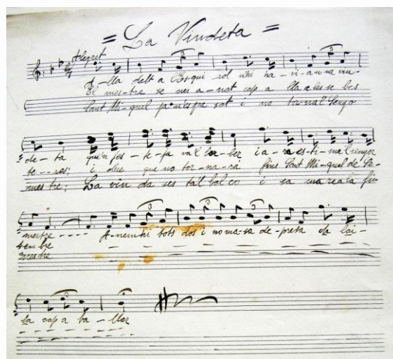
Figura 12 - Manuscrito del romance El mestre i la vindeta , con el título La vindeta