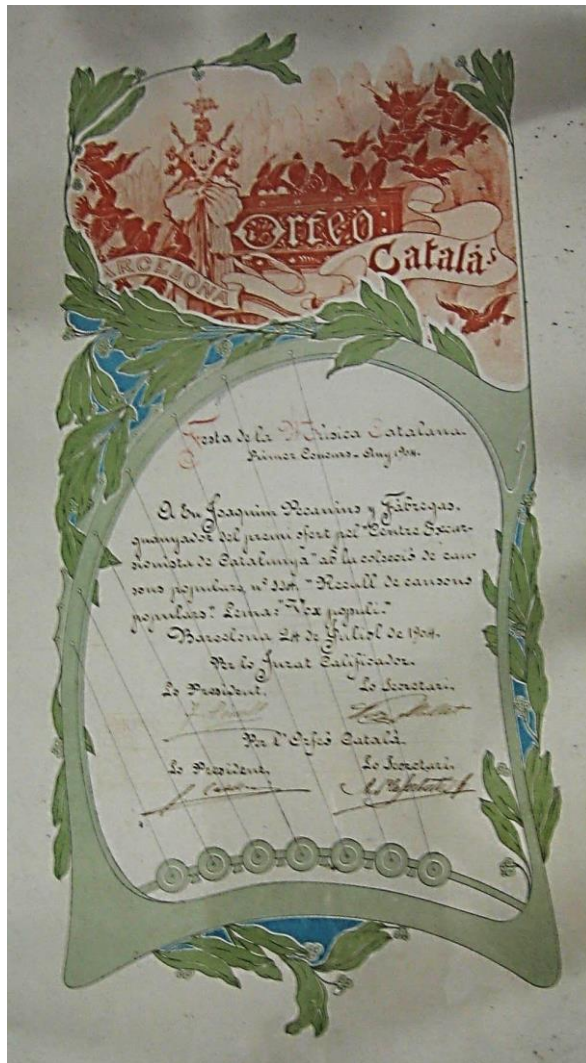
Figura 3 - Diploma del premi de la Festa de la Música Catalana que le otorgaren (1904)