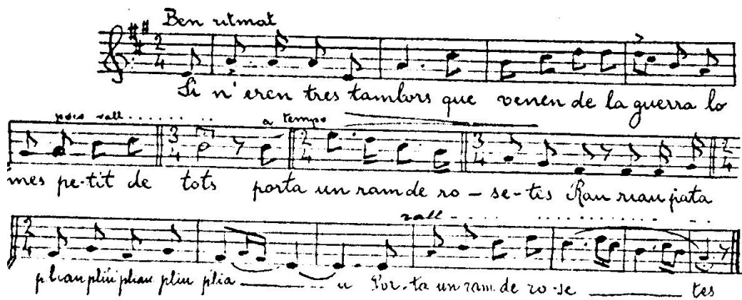
Figura 2 - Versión de Els tres tambors , en La Mayor, propia de Prats de Lluçanès