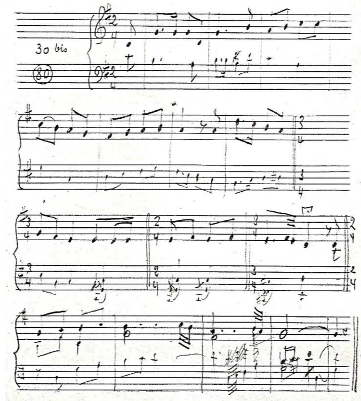
Figura 5 - Els tres tambons , del Lluçanès. Armonització para piano de Joaquim Pecanins