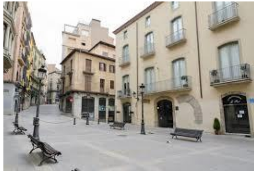
Figura 9 - Casa Oller de la família Soler, de Manresa (a la dreta de la imatge), on es ubicaria la vivenda d'Angeleta, segons el text del romanç. (construcció del s. XVIII)